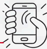
الإفراط في استخدام الأجهزة الإلكترونية