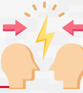
التدريب على المواجهة