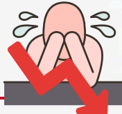
تراجع الاداء الدراسي